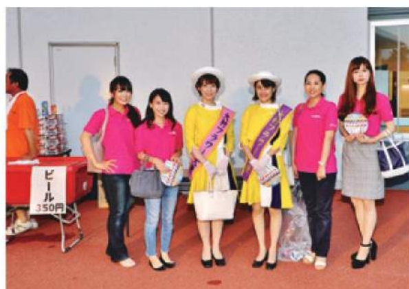
(花火大会への参画)