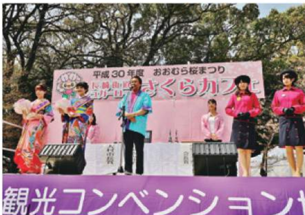
フラワー大使選彰式

4月1日(日)桜まつり「シュガーロード(長崎街道)大村すい〜つまつり」『さくらカフェ』イベントの中で「2018年度大村フラワー大使選彰式」を開催しました。大村の観光親善大使として、県内外での大村の観光PRのため1年間頑張ってください。