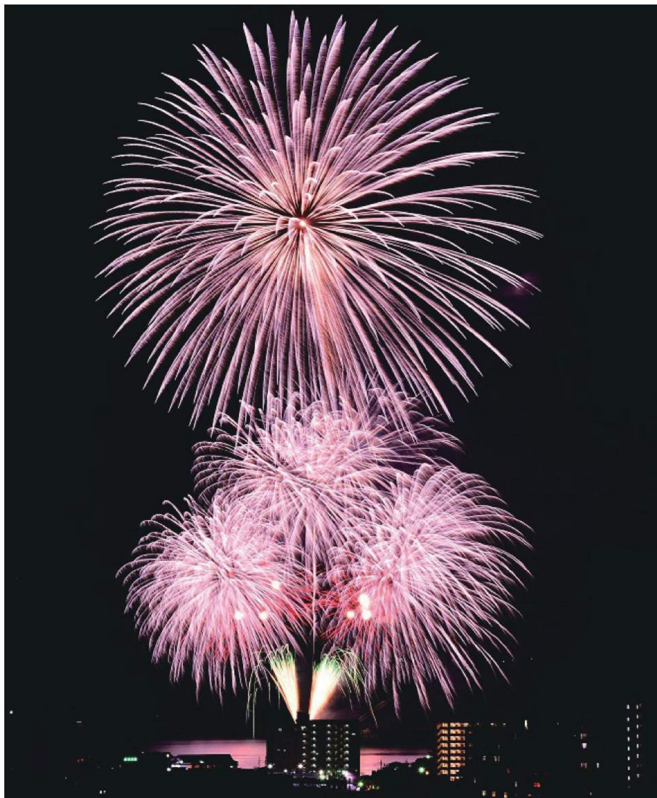
「2018おおむら夏越花火」