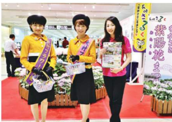
(長崎空港での花まつりPR)

フラワーメイツのメンバー19名は市内外の各種イベント等へ参加し大村の観光PRの一翼を担っています。